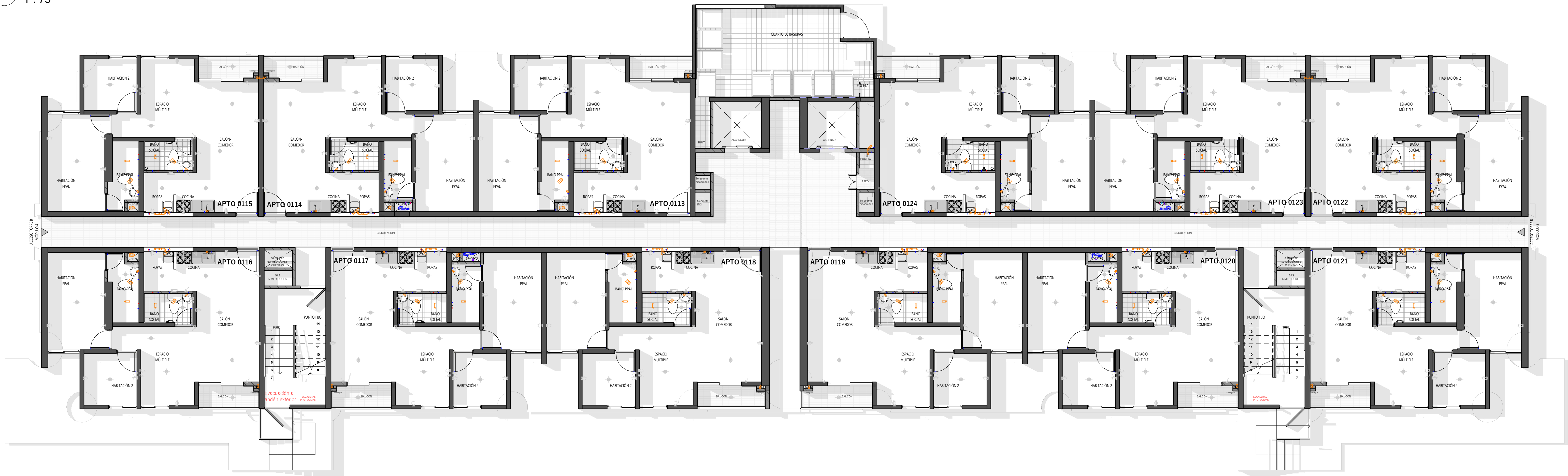
2 PISO 1 - REDES 1 : 75

No se debe demoler, regatear, hacer vanos y en fin cualquier actividad que afecte los elementos estructurales como vigas, muros y losas de su vivienda, cada uno de ellos hace parte fundamental de la estructura.