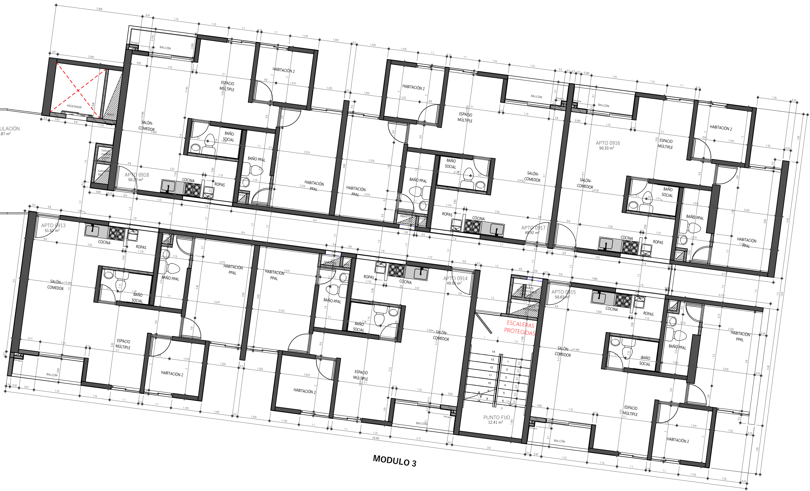
1 NIVEL 9 - PLANTA ARQUITECTÓNICA ACOTADA 1 : 75