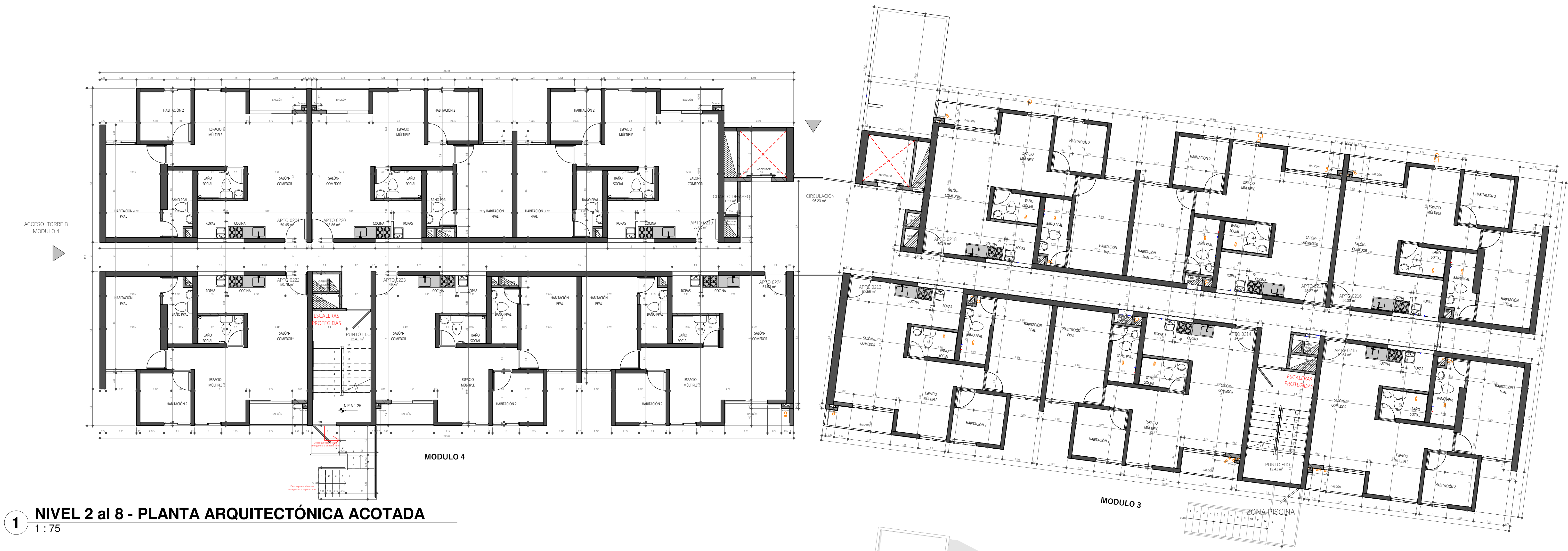
1 NIVEL 2 al 8 - PLANTA ARQUITECTÓNICA ACOTADA 1 : 75

SECCION TRANSVERSAL C/CI DEL SUR TORRE B