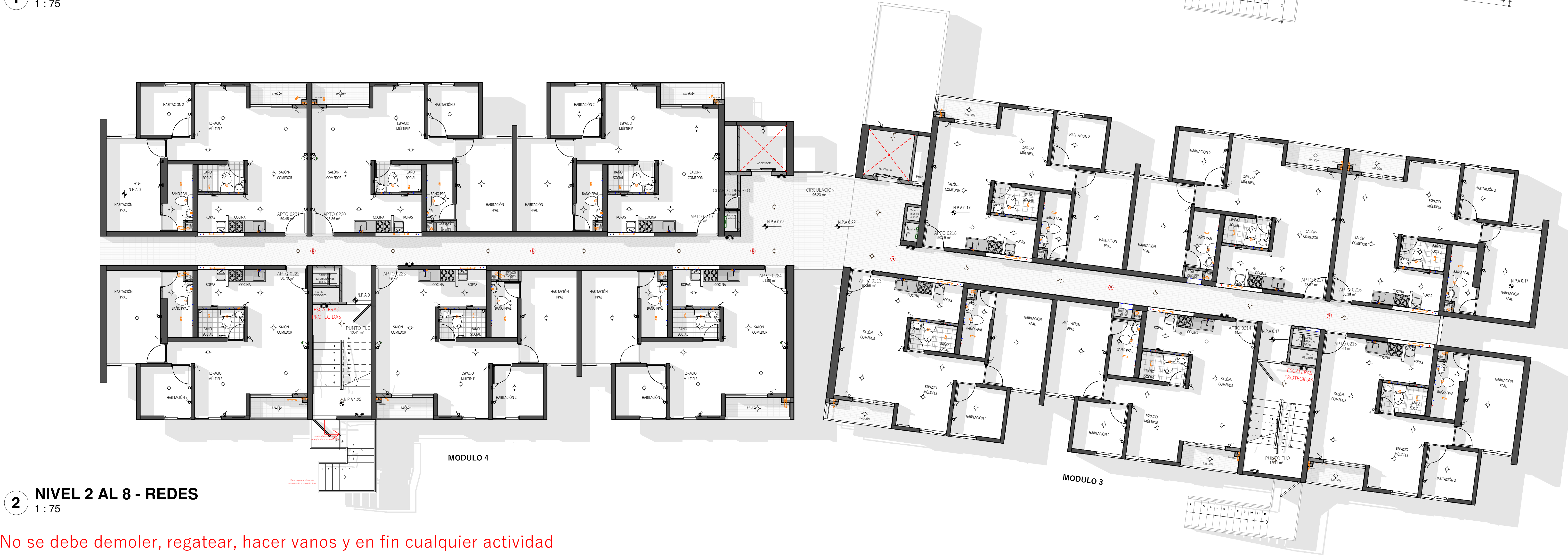
2 NIVEL 2 AL 8 - REDES 1 : 75

No se debe demoler, regatear, hacer vanos y en fin cualquier actividad que afecte los elementos estructurales como vigas, muros y losas de su vivienda, cada uno de ellos hace parte fundamental de la estructura.